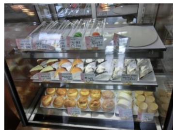
マカロン・ケーキなど