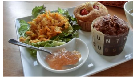
ベーカーズプレート ¥700 選べる2種類のブレッドと サラダ+スープ+ドリンク