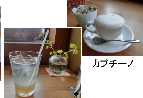
自家製ジンジャーエール カプチーノ