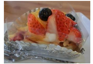
フルーツチーズタルト

※プレートは好きなジャムが1つ選べます。 写真はデコポンのジャムとイチジクのジャムです。