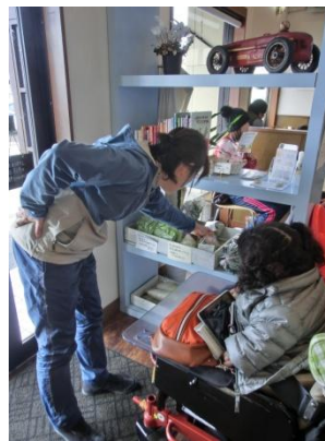
採れたて野菜の直売