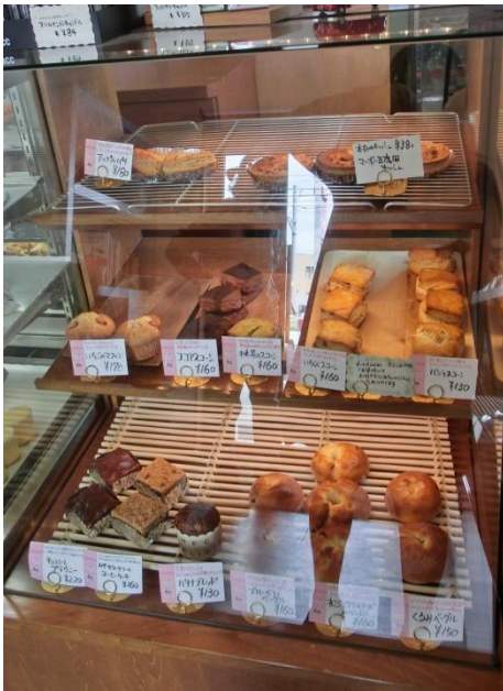
本日のブレッド (ベーグル・スコーン・マフィン)