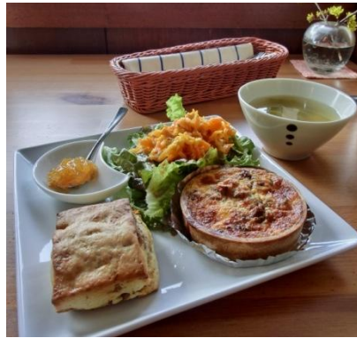
キッシュプレート ¥900 キッシュと選べるブレッド サラダ+スープ+ドリンク