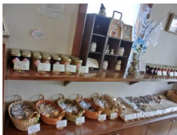
手作りジャムや焼き菓子

食べ応えのあるマフィンやベーグルの他に、シュークリームやマカロンなどのスイーツ組み合わせが楽しい手作りジャムも種類豊富に揃っている。 自家農園の新鮮野菜を使ったボリュームたっぷりおかずサラダやスープなどが付く限定ランチは超オススメ。(限定10食) 自家農園の新鮮野菜もお値打ちに買うことができる。 店員さんが1人でやっている小さなお店で、入口はスロープだが、開き戸なので介助者が必要。 自家製ジンジャーエールやサワーは、素朴でとても美味しい