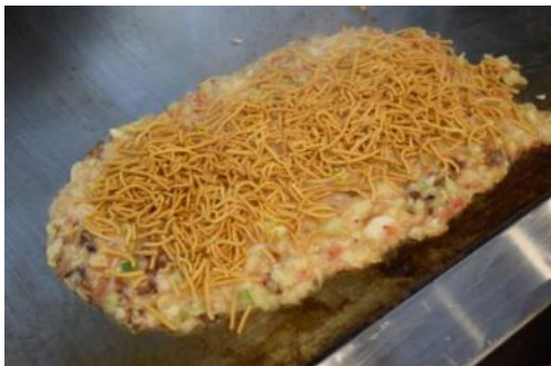
バリソバもんじゃ ¥710