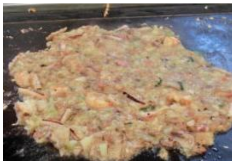
ミックスもんじゃ ¥1069