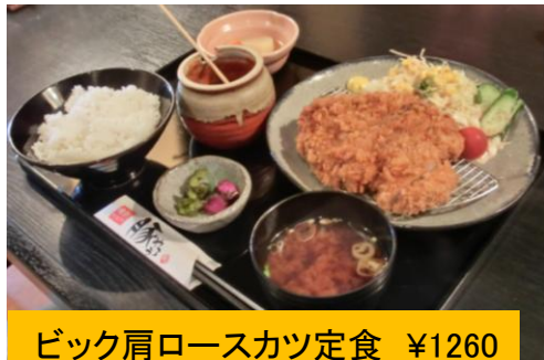
ビック肩ロースカツ定食 ¥1260