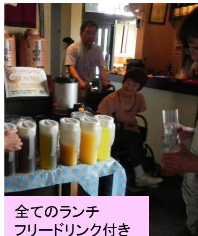
全てのランチ フリードリンク付き