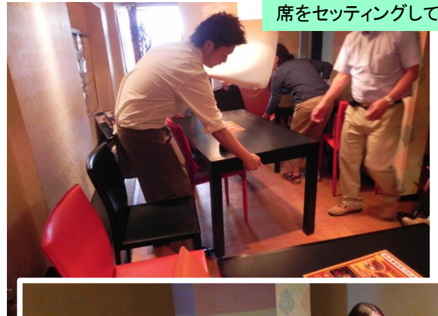
車いすで利用できるように 席をセッティングしてくれます