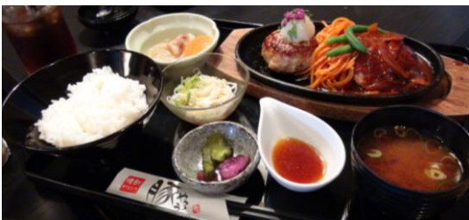
黒豚Wハンバーグランチ ¥1155(写真)