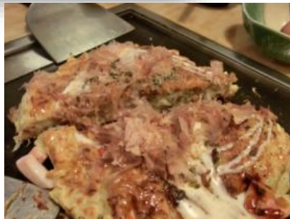
お好み焼きデラックス ¥980

全てのランチメニューに、 ご飯(おかわりOK)、味噌汁、 小鉢、漬け物、サラダ このセットが付いている