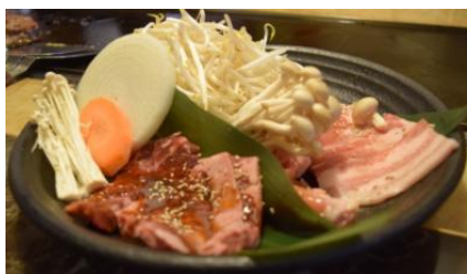
てっぱん焼肉定食 ¥980