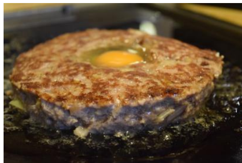
えんバーグ定食 ¥980 ※肉汁が凄く、ひっくり返す時に注意！！