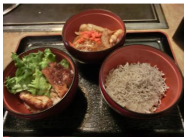
3種のミニ丼セット ¥850 (月替わり/限定10食)