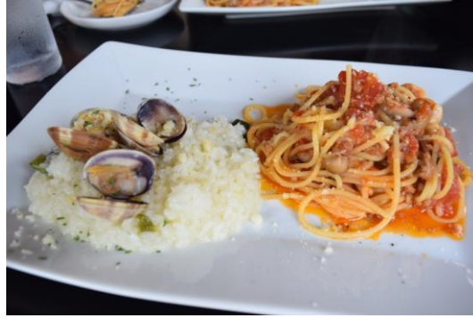
パスタ&リゾット 両方味わえるのが嬉しい