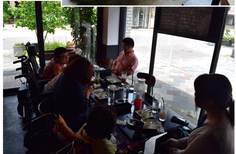
ガラス壁の店内は見通しが良く広々とした印象