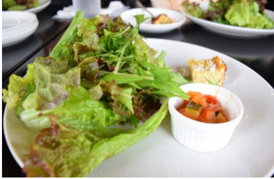
前菜(グリーンサラダとキッシュ) ボリューム満点

ランチ 11:00~14:00(L.O13:30) ディナー 17:30~23:00(L.O閉店1時間前) ※金・土・祝前日は24:00まで