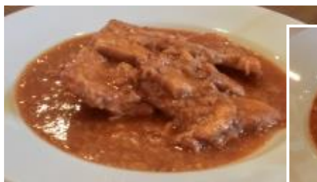
A.カルネ(豚肉) & タコスランチ