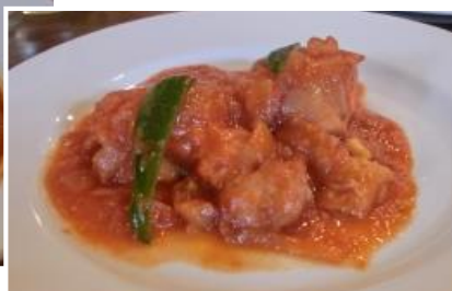
C.メキシカンポイヨ(鶏肉) & タコスランチ