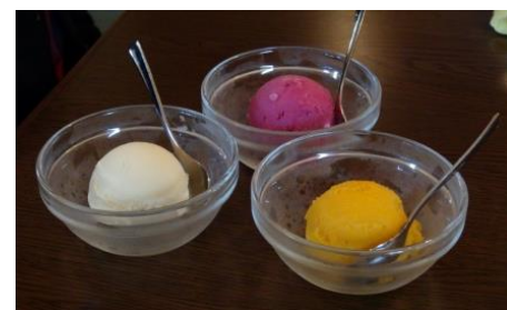
デザート (バニラ・カシス・マンゴー)