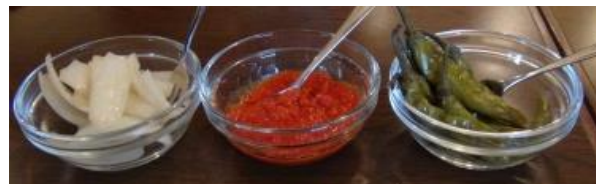
たまねぎのピクルス・サルサ・ハラペーニョ