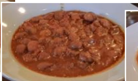
B.チレコン(豆) & タコスランチ