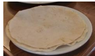
追加のトルティーヤ ¥130