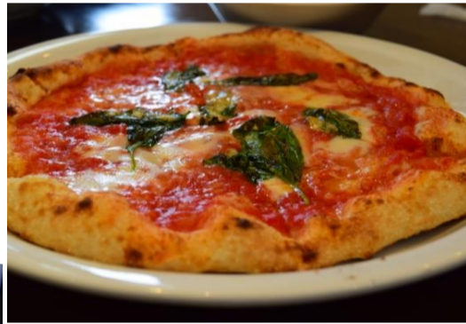
窯焼きマルゲリータ