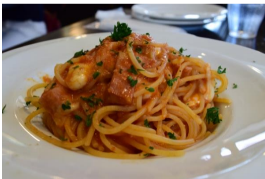
ナス&ベーコン &モッツアレラチーズの トマトスパゲティ