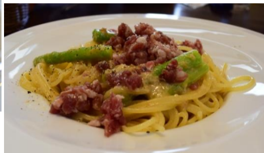
アスパラ&生ハムミンチの オイルスパゲティ