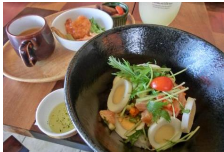
カフェ丼ランチ(5種の丼メニューから選ぶ) ¥1100 〔左:カフェロコ丼 右:タコライス〕