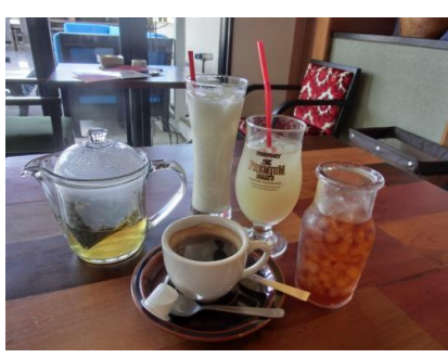
ランチのドリンク各種