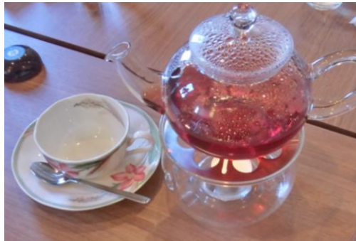
フレーバーティー ¥600