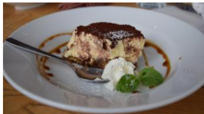
ランチ(食後)の オリジナルスイーツ