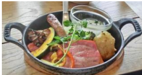
たっぷり野菜とプレミアムソーセージ X厚切りベーコンのシュークルート ¥1380