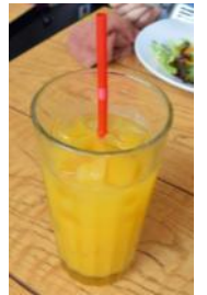
マンゴージュース