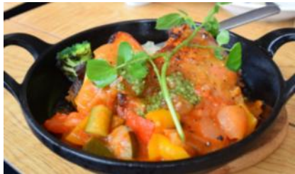
スモークサーモンの エッグベネディクト ¥1280