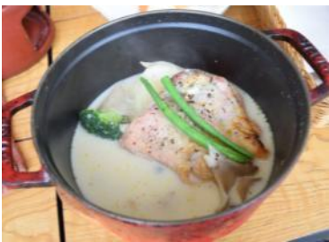
若鶏と採りたてキノコの 豆乳フリカッセ ¥1480