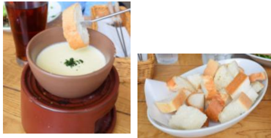
ミニチーズフォンデュ&パン