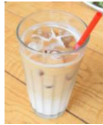
アイスカフェラテ